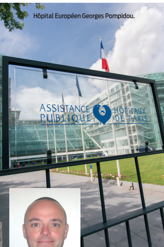
Hôpital Européen Georges Pompidou.

Le 18 janvier de 18h30 à 21h30 Amphithéâtre de l'Hôpital Européen Georges Pompidou, à Paris 35 euros Rens. et inscription : international@ecoledassas.fr 01 80 96 39 24